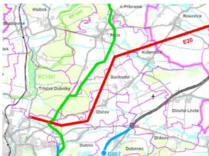
obr. ZÚR SK-veřejně prospěšné stavby-výřez.jpg

Řešené lokality nejsou v kolizi s žádnými z výše uvedených veřejně prospěšných staveb (dle nadřazené ÚPD).